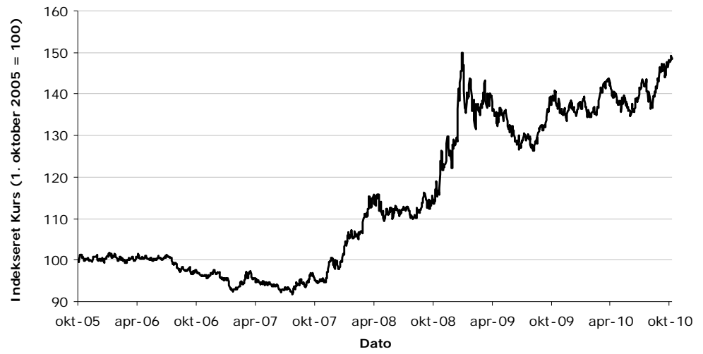
Figur 2. Indekseret kursudvikling på det Underliggende Valutapar, oktober 2005 til oktober 2010